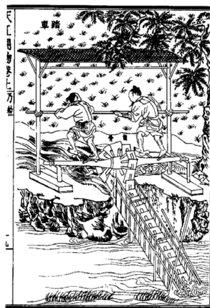
圖1 《天工開物》中的腳踏龍骨水車

從以上文獻記述及圖示中可看出，龍骨水車的起源、用途、構造、功效等介紹較為清晰，但龍骨水車的提水原理介紹僅止于“關水逆流而上”或“迴圈刮水上岸”等語帶過。然而，龍骨水車既是農耕時代先進的、獨特的提水工具，在其獨特的器具構造之外是否還有其獨特的提水工作機理，值得人們進一步認真探討，沿用的“關水逆流而上”和“迴圈刮水上岸”原理描述推敲起來也存在一定差別，原理本身更有細節問題的需要加以分析。