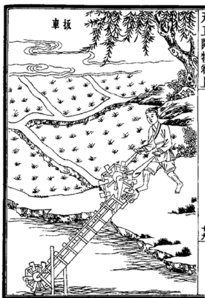
圖2 《天工開物》中的手挽龍骨水車