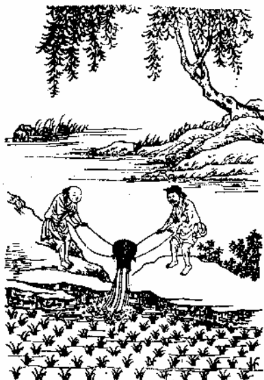
圖3 《農政全書》所載用戽門戽水（揚水）

龍骨水車的地域特色還體現在一些相關民間文化上，比如龍骨製作木料的選取，長沙縣農村有“一梅二榭三槐四櫟”口訣，其地方古風非常濃厚。櫟木是南方人熟知的結實耐用木料，槐樹是北方人熟悉的優良用材，但對製作龍骨來說，槐雖優於櫟但都還不是最好的木料；最好的木料是一般人不習慣視作木料樹種的梅樹，梅樹作為人們熟知的花、果樹木稀有砍伐，但從“梅樹木材堅韌，是雕刻及製作算盤珠的良材”這樣的典籍記載來看，排在製作龍骨優良木料第一是可信的；作為製作龍骨的第二好木料榭樹，最能體現這句選材口訣的長沙地方文化特色，因為榭樹的“榭”字詞典上只作地名“榭梨”專用字解，而榭梨是長沙縣的一個古鎮，坐落在瀏陽河邊，過去也稱榔梨或榔林，現在網頁等許多地方對這個地名“榭”、“朗*”（這裏*表示該字下有“木”部而輸入字形檔無此字）、“榔”不分。但“榭”與“榔”音調不同（長沙方言和普通話都如此），一般長沙人也不知道榭樹，只有知道這句口訣的人知道榭樹就是人們常說的蚊榔樹，細心觀察的人看到過四五月間蚊榔樹有的綠葉上鼓起的淺紅小囊裏果然“結出”幼蚊而始信古人命名不虛！在《長沙方言詞典》裏“蚊榔子樹”解釋為“榔榆樹”，再將樹名與“榔林”、“榭梨”地名聯