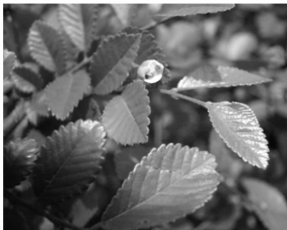
圖5 剝開的蚊榔樹葉泡囊裏有孵化出的幼蚊